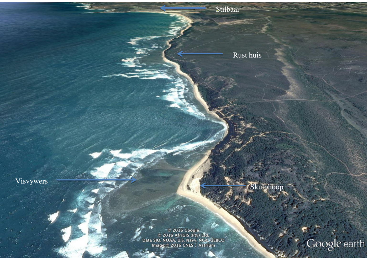
Rietvlei kus met die visvywers in die voorgrond en Stilbaai in die verte. Rietvlei coast with fish traps in the foreground and Stilbaai in the distance.

Please bring: a brush, beach things, walking shoes or bare foot and something to eat and drink.