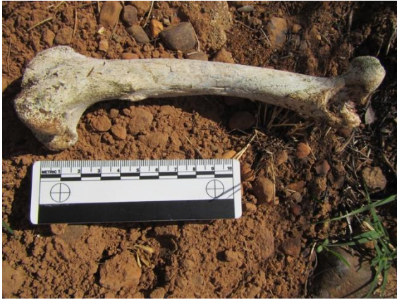
Fig. 3. 'n Been gevind reg langs die vermeende kraal.