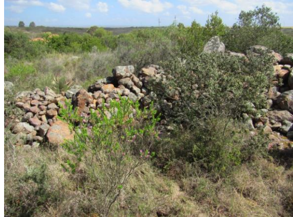
Fig. 4. Die 9 m muur langs die kraal.