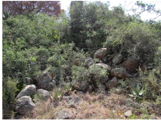
Fig. 6. Die agterste kraalmuur.