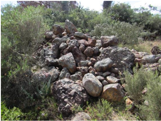
Fig. 5. Nog 'n aansig van die 9 m muur.