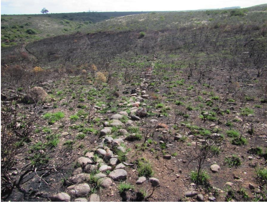
Fig. 7. Die kliplyn wat min of meer in 'n westelike rigting strek. Dit is sigbaar op Google earth en maak 'n hoek verder wes en gaan dan in min of meer 'n noord-westelike rigting.