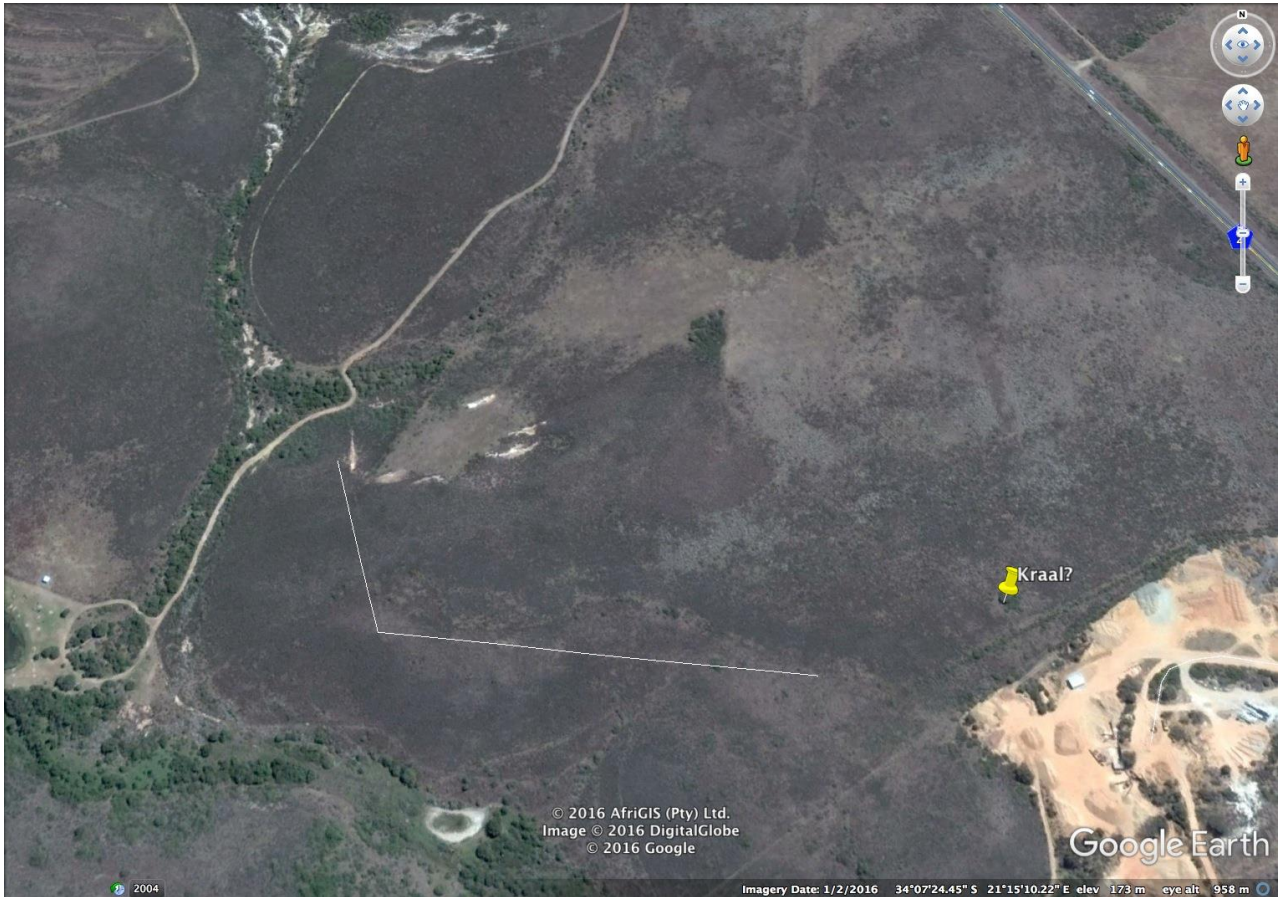
Fig. 1. Die vermeende kraal en die gapakte kliplyn. Die kliplyn is sigbaar op Google earth.